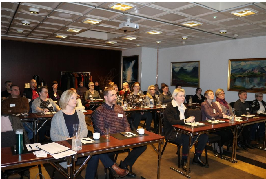
Fjölmennt á starfsdegi trúnaðarmanna á Hótel KEA í janúar.