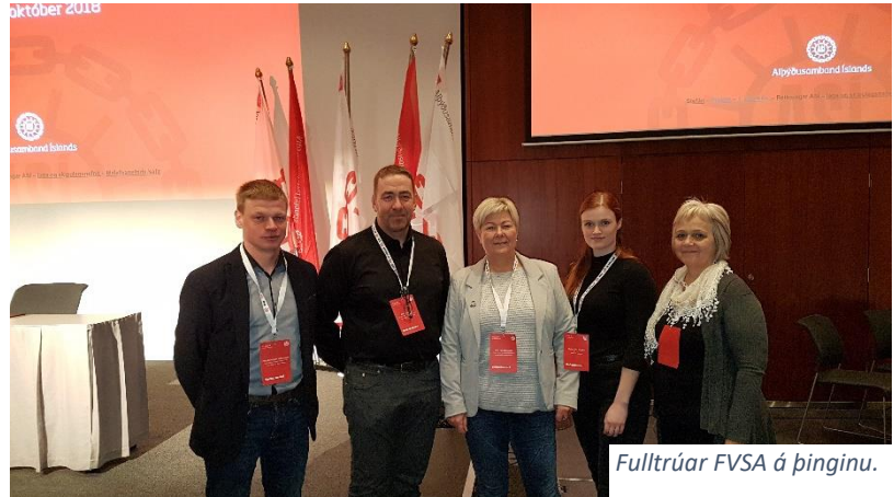
Fulltrúar FVSA á þinginu.

Þing ASÍ var í alla staði málefnalegt og vel skipulagt. Unnið var í fimm nefndum sem skiptust í: Tekjuskipting og jöfnuður, jafnvægi atvinnuþátttöku og einkalífs, tækniþróun og skipulag vinnunnar, heilbrigðisþjónusta og velferðarkerfið og húsnæðismál.