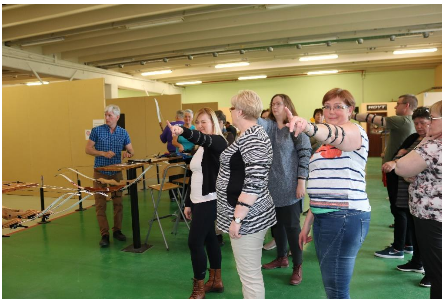
Félagmenn voru ekki lengi að ná réttu töktunum í Bogfiminni.

Farið var í árlega ferð með trúnaðarmönnum, trúnaðarráði og stjórnun FVSA föstudaginn 1. júní sl. Lagt var af stað frá Alpýðuhúsinu kl. 18:00 og ferðinni fyrst heitið í Bogfimisetrið við Austursíðu. Þjálfari við Bogfimisetrið og aðstoðarmaður hans tóku á móti hópnum og fræddi hann um ýmis öryggisatriði sem þarf að hafa í huga í bogfimi áður en hópurnir tók til við að skjóta. Eftir að hafa skotið nægju sína í Bogfimisetrinu hélt hópurnir áfram út á Hauganes þar sem sest var að snæðingi á Baccalá bar. Fíllinn kom og var með pub quiz fyrir hópinn þar sem var mikið hlegið. Heimkoma var um miðnætti.